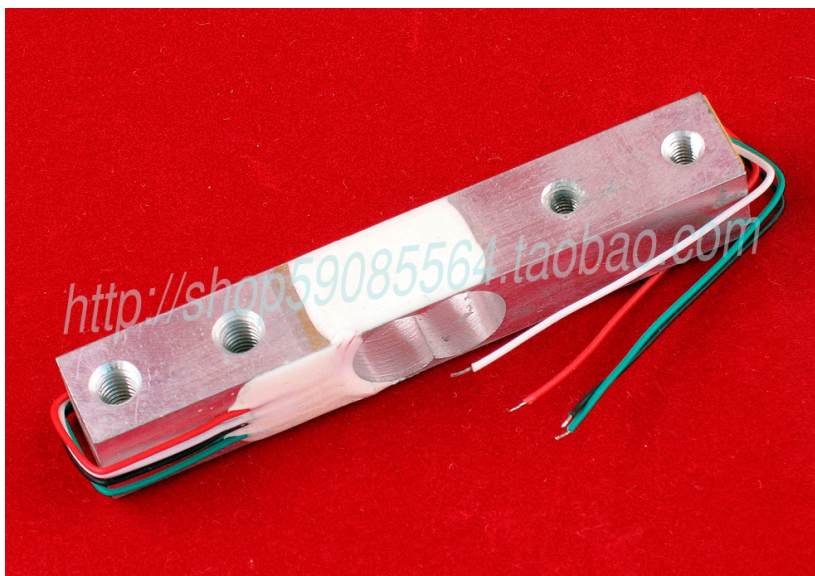
图 1 双孔悬臂平行梁应变式称重传感器

实验电子秤、邮政电子秤、厨房电子秤等一般选用双孔悬臂平行梁应变式称重传感器。它的特点是：精度高、易加工、结构简单紧凑、抗偏载能力强、固有频率高，其典型结构如图 1 所示。